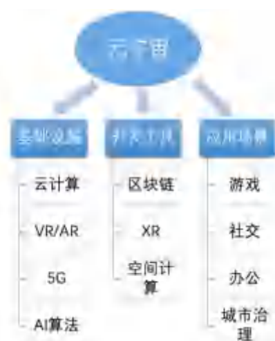
图 1 元宇宙技术与应用场景

元宇宙也可以应用于税收征管方面，服务于税收征纳活动，可以提高税务部门征税效率和纳税人的办税效率。目前，我国税收征管向智慧税务方向转变，即综合运用云计算、大数据、互联网等前沿技术，实现业务管理大数据化、纳税渠道协同化、办税服务精细化，提高税务部门服务质量和效率，提升纳税人满意度。未来，利用 VR 的高沉浸感和 AR 的较强互动性，为税收征管和纳税人纳税带来更多的便利。另外，在元宇宙高数字化的世界中，纳税主体的交易活动隐匿性大大降低，实行完全的数字化税收监管和服务，纳税人的纳税遵从度会自动提高。