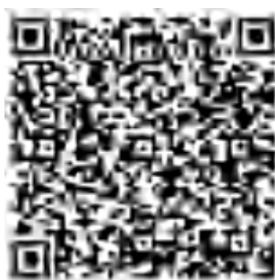
金融元宇宙研究二群