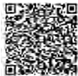
金融元宇宙研究一群