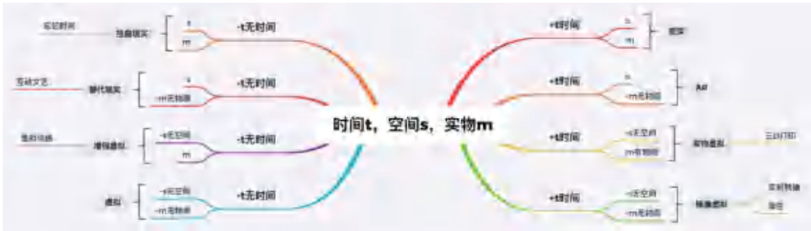
本图引自《区块链+党政干部学习读本》（中共中央党校出版社）